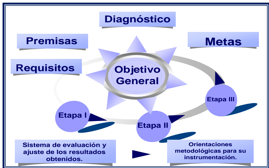
Figura No. 1. Estructura del Procedimiento de gestión cultural del proceso de profesionalización docente para contribuir al desempeño pedagógico cultural del profesorado universitario.

Etapa de Organización sociocultural de la profesionalización docente.